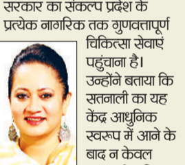
आसपास के दर्जनों गांवों के हजारों लोगों के लिए एक जीवनरक्षक केंद्र सिद्ध होगा।

स्वास्थ्य मंत्री ने कहा कि हरियाणा सरकार का संकल्प प्रदेश के प्रत्येक नागरिक तक गुणवत्तापूर्ण चिकित्सा सेवाएं पहुंचाना है। उन्होंने बताया कि सतनाली का यह केंद्र आधुनिक स्वरूप में आने के बाद न केवल सतनाली, बल्कि आसपास के दर्जनों गांवों के हजारों लोगों के लिए एक जीवनरक्षक केंद्र सिद्ध होगा। उन्होंने कहा कि विभाग के अधिकारियों को भी निर्देश दिए गए हैं कि स्वीकृत बजट के साथ निर्माण कार्य को शीघ्र अंतिम रूप दिया जाए, ताकि जनसाधारण को इस सुविधा का लाभ तुरंत मिल सके।