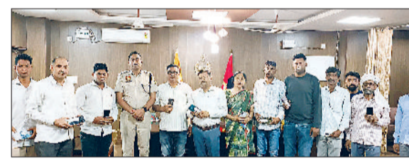
नारनौल। मालिकों को मोबाइल सौंपते हुए।

इस पूरी प्रक्रिया में केंद्र सरकार की ओर से जारी सीईआईआर पोर्टल ने महत्वपूर्ण भूमिका निभाई। अपने खोए हुए कीमती मोबाइल वापस पाकर सभी मालिकों के चेहरे खुशी