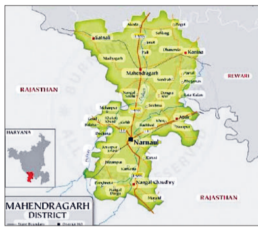
नारनौल। महेन्द्रगढ़ जिला का नक्शा।

हरियाणा के गठन के समय 1 नवंबर 1966 को राज्य में 7 जिले और 51 विधानसभा सीटें थीं। 1967 में सीटें बढ़कर 81 हुईं और 1977 में यह संख्या 90 तक पहुंची, जो आज भी स्थिर है। साल 2007-08 में परिसीमन हुआ, लेकिन कुल सीटों की संख्या में कोई वृद्धि नहीं की गई और यह प्रक्रिया भी 2001 की जनगणना के आधार पर ही पूरी की गई। महेन्द्रगढ़ जिले का राजनीतिक इतिहास इस असंतुलन को और गहराई से दर्शाता है। 1967 में इस क्षेत्र में नारनौल, महेन्द्रगढ़, अटेली, कनीना, रेवाड़ी, जाटसाना और बावल समेत कुल 7 विधानसभा सीटें थीं। बाद में कनीना सीट समाप्त कर दी गई और 1989 में रेवाड़ी अलग जिला बनने के बाद तीन सीटें रेवाड़ी, बावल और जाटसाना-वहां चली गईं। इसके बाद महेन्द्रगढ़ जिले में केवल 3 सीटें ही बचीं। लंबे समय तक इस सीमित प्रतिनिधित्व के कारण जिले की विकास की दौड़ में नुकसान उठाना पड़ा। साल 2007-08 के परिसीमन में नांगल चौधरी को जोड़कर सीटों की संख्या 4 की गई, लेकिन यह बड़ोत्तरी की वास्तविक जनसंख्या के मुकाबले काफी कम मानी जाती है।