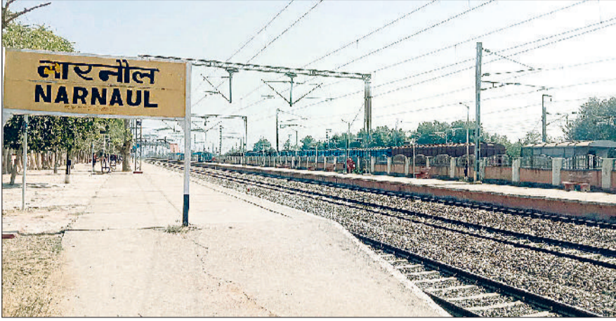
नारनौल। रेलवे स्टेशन।