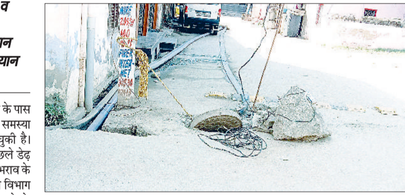
नारनौल। कुंडी कनेक्शन करके मोटर एवं पाइपों द्वारा की जा रही सीवर निकासी।