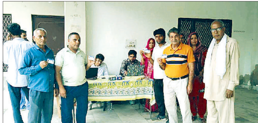
महेन्द्रगढ़। आभा कार्ड बनवाते मोहल्लावासी।