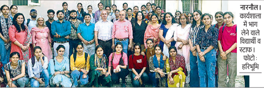
नारनौल। कार्यशाला में भाग लेने वाले विद्यार्थी व स्टाफ।

हरिभूमि न्यूज नारनौल राजकीय महिला महाविद्यालय के भूगोल विभाग में रिमोट सेंसिंग व जीआईएस पर आयोजित दो दिवसीय कार्यशाला का समापन हो गया। इस कार्यशाला में महिला महाविद्यालय की छात्राओं के अतिरिक्त राजकीय महाविद्यालय के स्नातकोत्तर के छात्रों ने भी भागीदारी की। प्राचार्य डॉ. आरपी